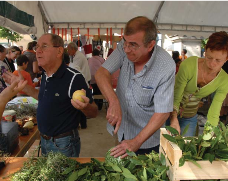
Les jardiniers du Fort, lors de la fête du 19 septembre 2009.