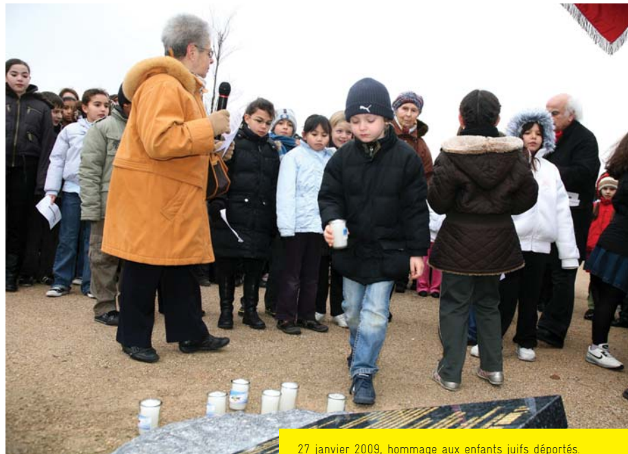
27 janvier 2009, hommage aux enfants juifs déportés.

les associations poursuivent les mêmes buts : éveiller les consciences et former les futurs citoyens. Nous menons un travail complémentaire en articulant au mieux l'apprentissage des faits et l'éveil civique par la rencontre de personnes qui ont vécu ou se sont intéressées à cette période de l'histoire. » L'implication des plus jeunes revêt une importance particulière au moment où vient de se créer une commission Mémoires réunissant des associations, l'inspection de l'Éducation nationale et des élus. Avec une interrogation : comment faire émerger une mémoire partagée dans laquelle chaque Ivryen puisse se reconnaître ?