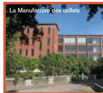
La Manufacture des œillets