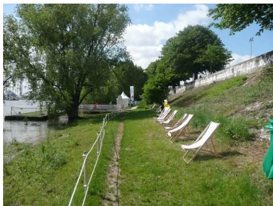
Aménagement provisoire berges quai Pourchasse - Festival de l'Oh 2012