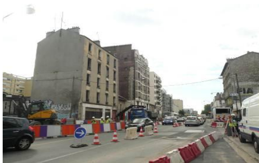
Travaux du tramway Orly-Paris sur la RD 5