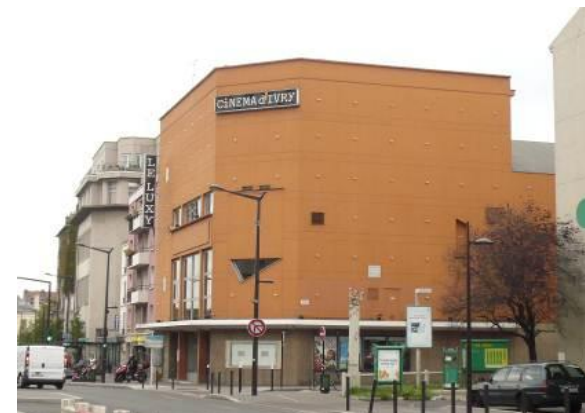
Cinéma Le Luxy