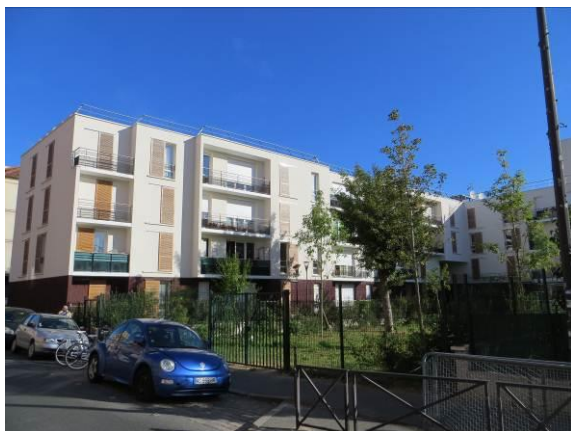
Logements sociaux angle Marat/Colombier