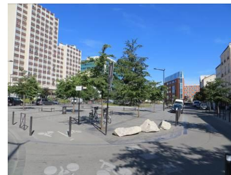
Place Jean Ferrat