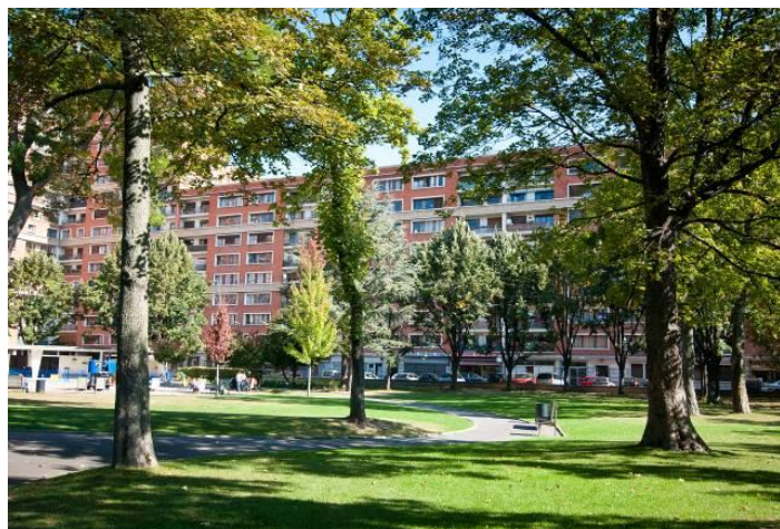
Logements sociaux Maurice Thorez