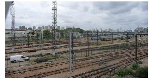
Voies ferrées vues de la passerelle Muller