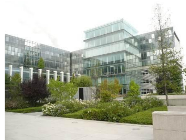
Immeubles de bureaux