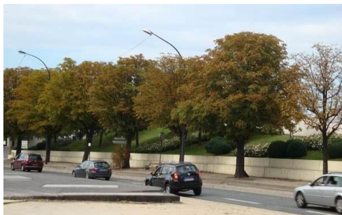
Quai Marcel Boyer