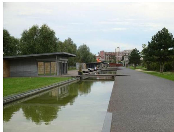
Parc des Cormailles