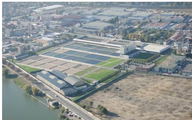
Secteur des Halles

certains usages impératifs à la vie locale (livraisons, personnes à mobilité réduite, 2 roues, chalants...) ;