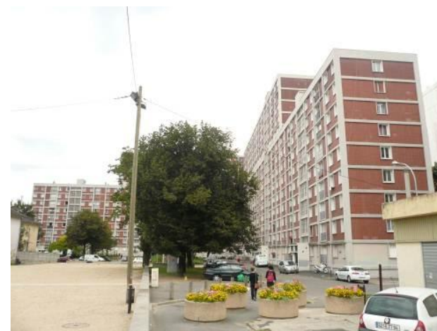
Logements sociaux Gagarine