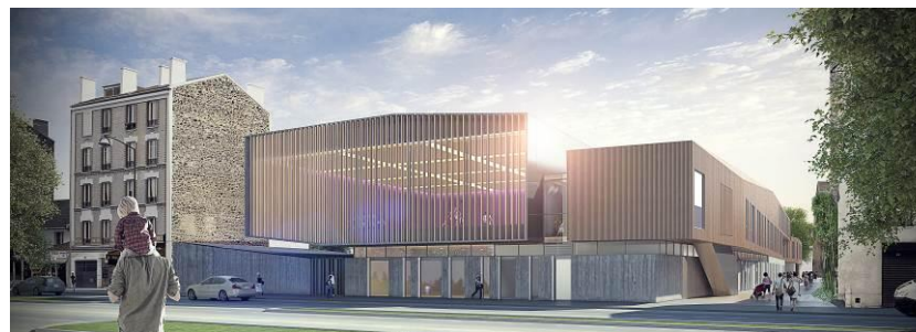
Future école du Quartier Parisien (livraison 2014)