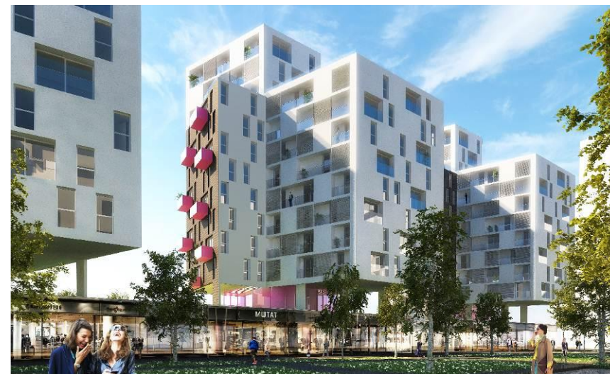
Place du Général de Gaulle (ZAC du Plateau) - Création d'une nouvelle polarité commerciale.