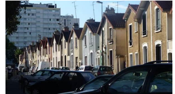
Rue Jules Ferry