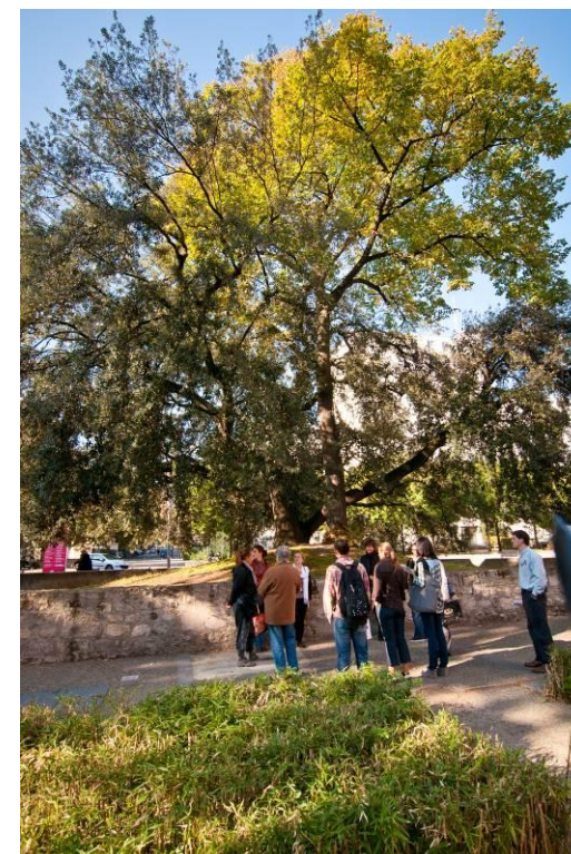
Secteur du Fort d'Ivry