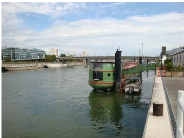
Berges de la Seine