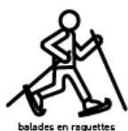
balades en raquettes