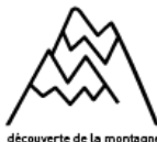
découverte de la montagne