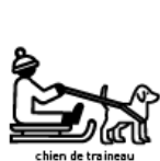
chien de traîneau