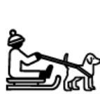
chien de traîneau

Des vacances inoubliables à la découverte de la montagne pour une semaine pleine de sensations. Une belle occasion de faire du ski, encadré par des moniteurs de l'école du ski français.