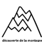
découverte de la montagne