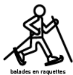
balades en raquettes