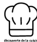
découverte de la cuisine