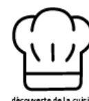
découverte de la cuisine

L'absence de la neige entrainerait la mise en place d'activités de substitution