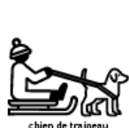
chien de traîneau