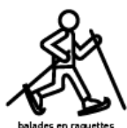
balades en raquettes