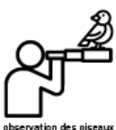
observation des oiseaux