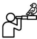
observation des oiseaux