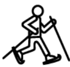
balades en raquettes