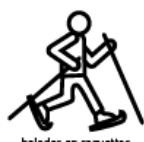
balades en raquettes