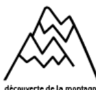
découverte de la montagne