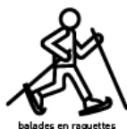
balades en raquettes