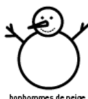
bonhommes de neige