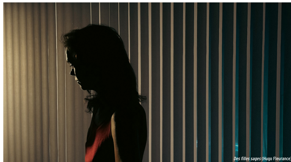
Des filles sages