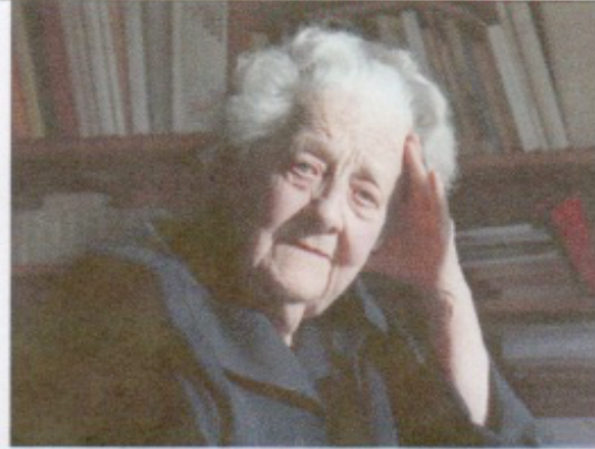
« Elle a su traverser le mal sans se prendre pour l'incarnation du bien », disait d'elle Tzvetan Todorov.