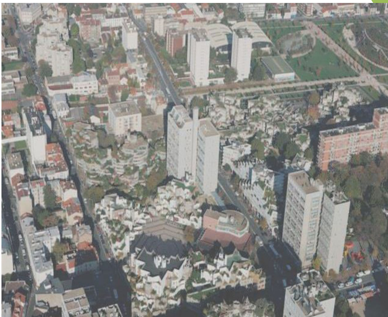
ZAC Gagarine à Ivry-sur-Seine