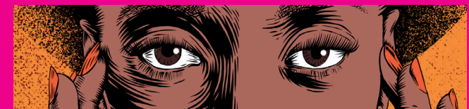
Illustration: Boris Semenkako

Retrouvez tout le programme commémoratif Ivry contre l'esclavage sur ivry94.fr