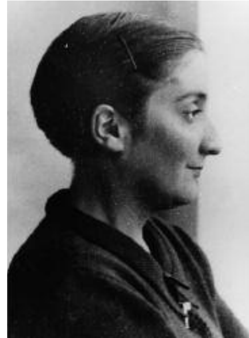
Association des amis de Madeleine Delbrêl