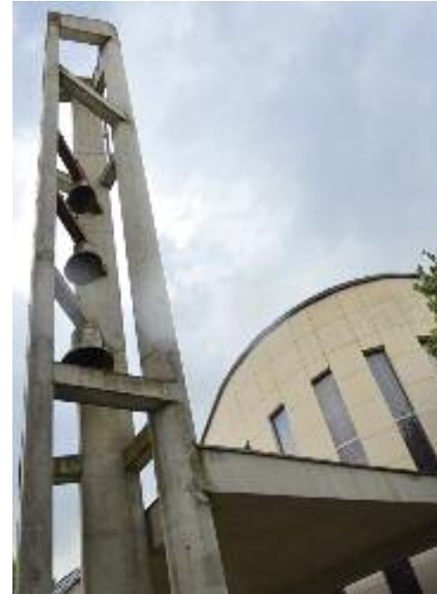
6 Église Sainte-Croix