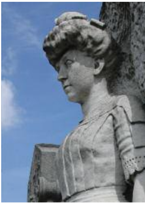
4 Cimetière communal ancien