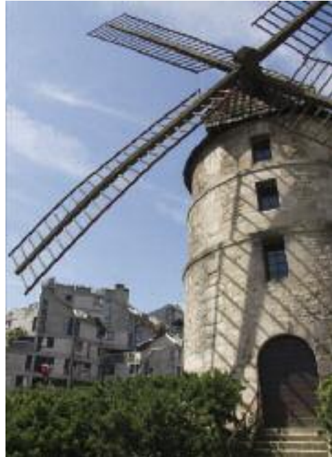
12 Moulin de la Tour