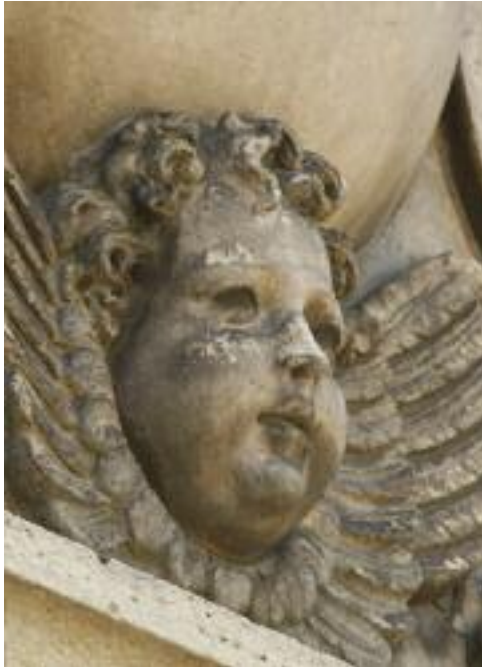
Hôpital Charles Foix