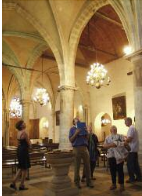
7 Église Saint-Pierre-Saint-Paul